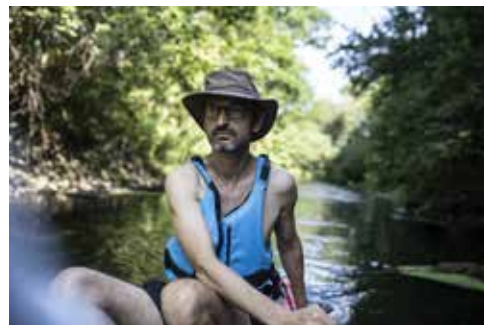
Třeba to, že na ní nejspíš nikoho nepotkáte.

Výhodou Bíliny oproti jiným tokům je skutečnost, že je sjízdna prakticky celoročně, protože ji napájí takzvaný podkrušnohorský přivaděč zásobující vodou průmyslové podniky v širokém okolí. Podle vodáckého serveru Raft.cz má Bílina v době naší plavby nedostatek vody, podle Grünbauma ale nemusíme mít obavy. Sjízdňý úsek této řeky měří necelých padesát kilometrů – začíná v Mostě a končí v Ústí nad Labem, kde se vlévá do Labe.