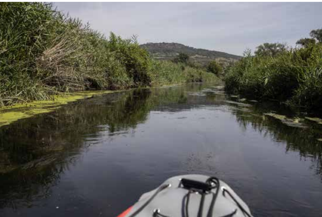
Odborníci potvrzují, že voda je pro běžný kontakt bezpečná.