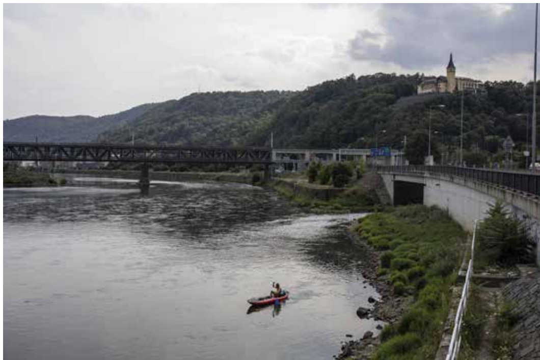
Vplutí do Labe v sobě má ale něco majestátního.

České inspekce životního prostředí posílá báseň, která se říkala v době, kdy v sedmdesátých letech minulého století vyrůstal ve městě Bílina. „Okolo Bíliny voděnka teče, kdo si k ní přičuchne, chytanou ho křeče.“ Těše doufám, že tato slova dávno neplatí.