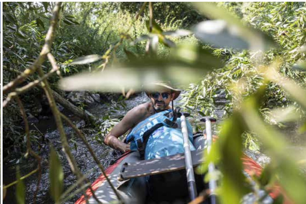
A místy dobrodružná kvůli spadným stromům, přes které je nutné přenést loď.

a v podstatě se jedná o standardní řeku, která se až tolik neliší od jiných, turisticky oblíbených toků. Státní podnik Povodí Ohře, který kvalitu vody v Bílině dlouhodobě monitoruje, dokládá výrazné zlepšení prostřednictvím grafu, jenž znázorňuje její znečištění amoniakálním dusíkem. Jeho přítomnost ve vodě je ukazatelem jak fekálního (tedy z komunálních čistíček), tak průmyslového znečištění (čili z továren). Zatímco ještě v osmdesátých letech minulého století překračovala koncentrace amoniakálního dusíku v Bílině povolenou míru i stonásobně, na přelomu tisíciletí už to bylo zhruba dvacetinásobně a loni dokonce jen dvojnásobně. Dnešní míra znečištění je tedy stále vyšší než ve většině tuzemských řek, ale nejedná se už o vyložený extrém. Znamená to tedy, že je Bílina zcela neškodná?