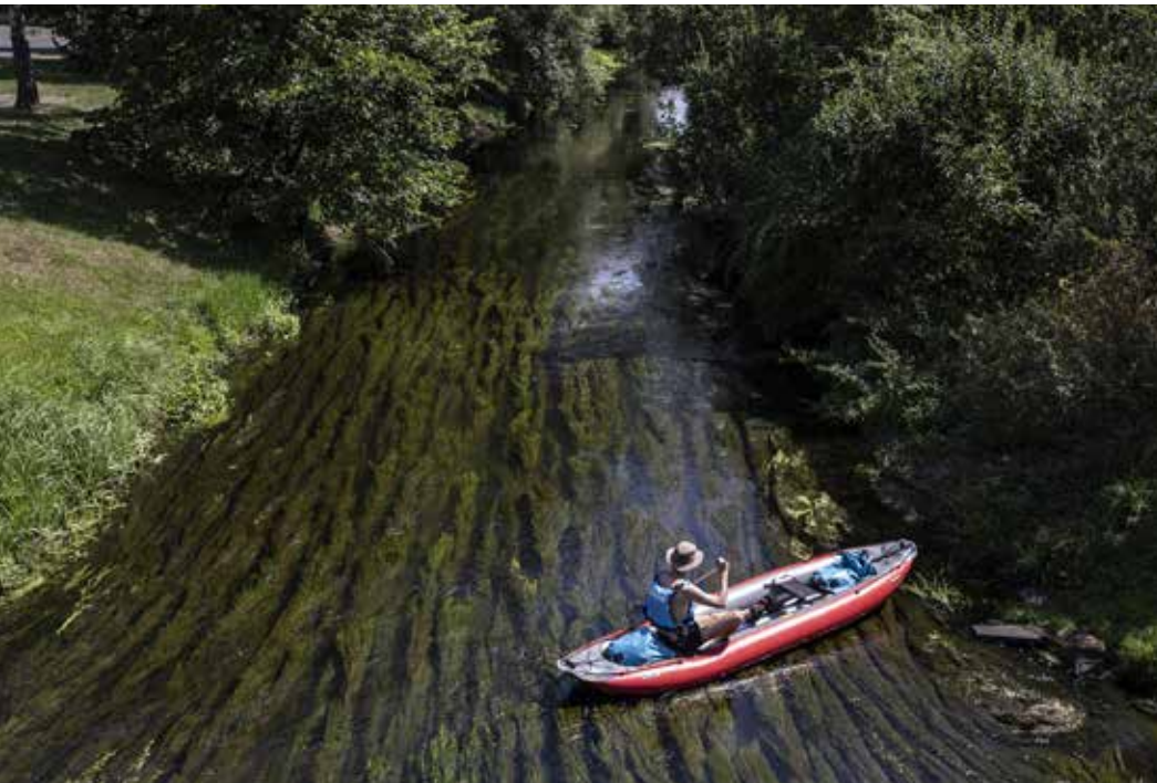
Nijak zvlášť nezapáchá, její voda je průhledná, na dně pod hladinou se ladně vlní dlouhé zelené řasy.