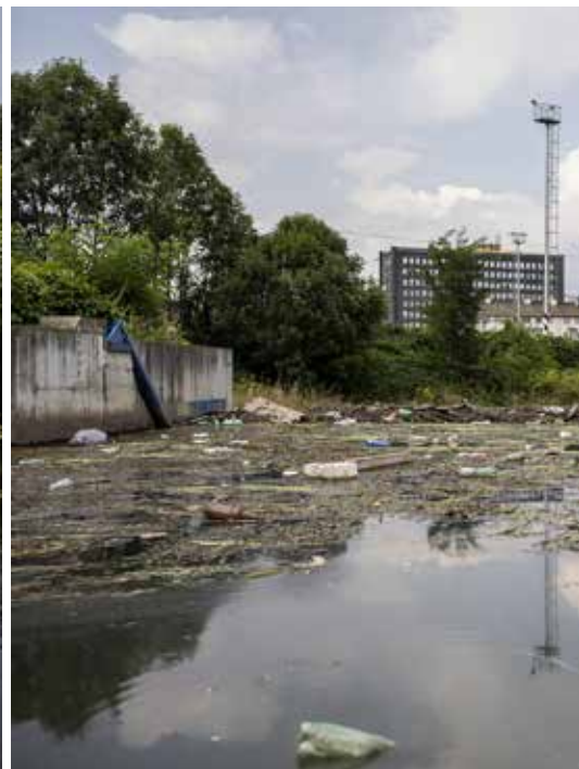
Na konci toku ale začíná více zapáchat a na závěrečném jezu se hromadí odpady.

Lidé spěchající za svými denními úkoly si na kánoji plouvající městem ukazují prstem, což dokládá, že vodák je v těchto končinách stále ještě vzácným úkazem.