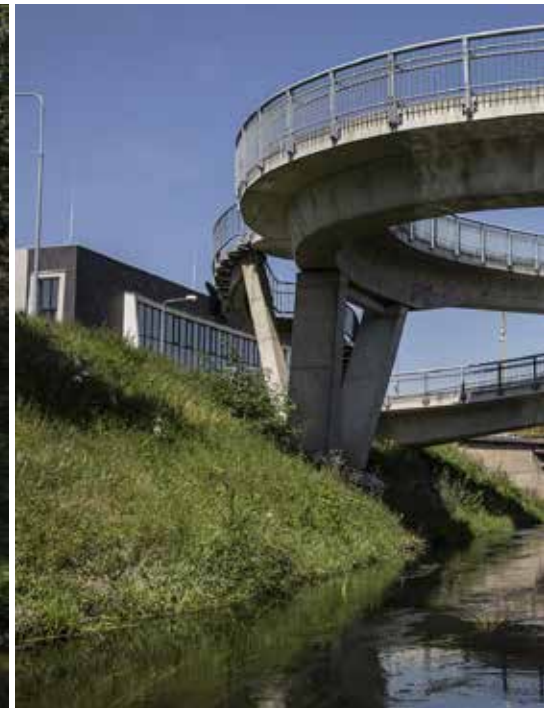
Plavba průmyslovou krajinou je svérázná. (Průjezd městem Bílina)

Majitel půjčovny doporučuje začít plavbu až v Obrnicích, tedy pár kilometrů po proudu pod Mostem, abychom se vyhnuli několik stovek metrů dlouhému přenašení lodě u elektrárny v mostecké čtvrti Chanov. Skončit radí již v malebné víscce Stadice, abychom nemuseli absolvovat plavbu průmyslovými Trmicemi a špinavým závěrem v Ústí nad Labem. My ale chceme získat kompletní zážitek, a tak nasedáme už v Mostě s cílem doplout až do Labe. Začínat ještě výše proti proudu nejde z jednoduchého důvodu: nad Mostem se nachází povrchový lom ČSA, kde je tok řeky sveden do ocelového potrubí. Po chystaném útlumu dolu má být ovšem Bílina z trubek rozvolněna do volně meandrujícího koryta a v budoucnu tedy možná půjde startovat ještě o něco výše.